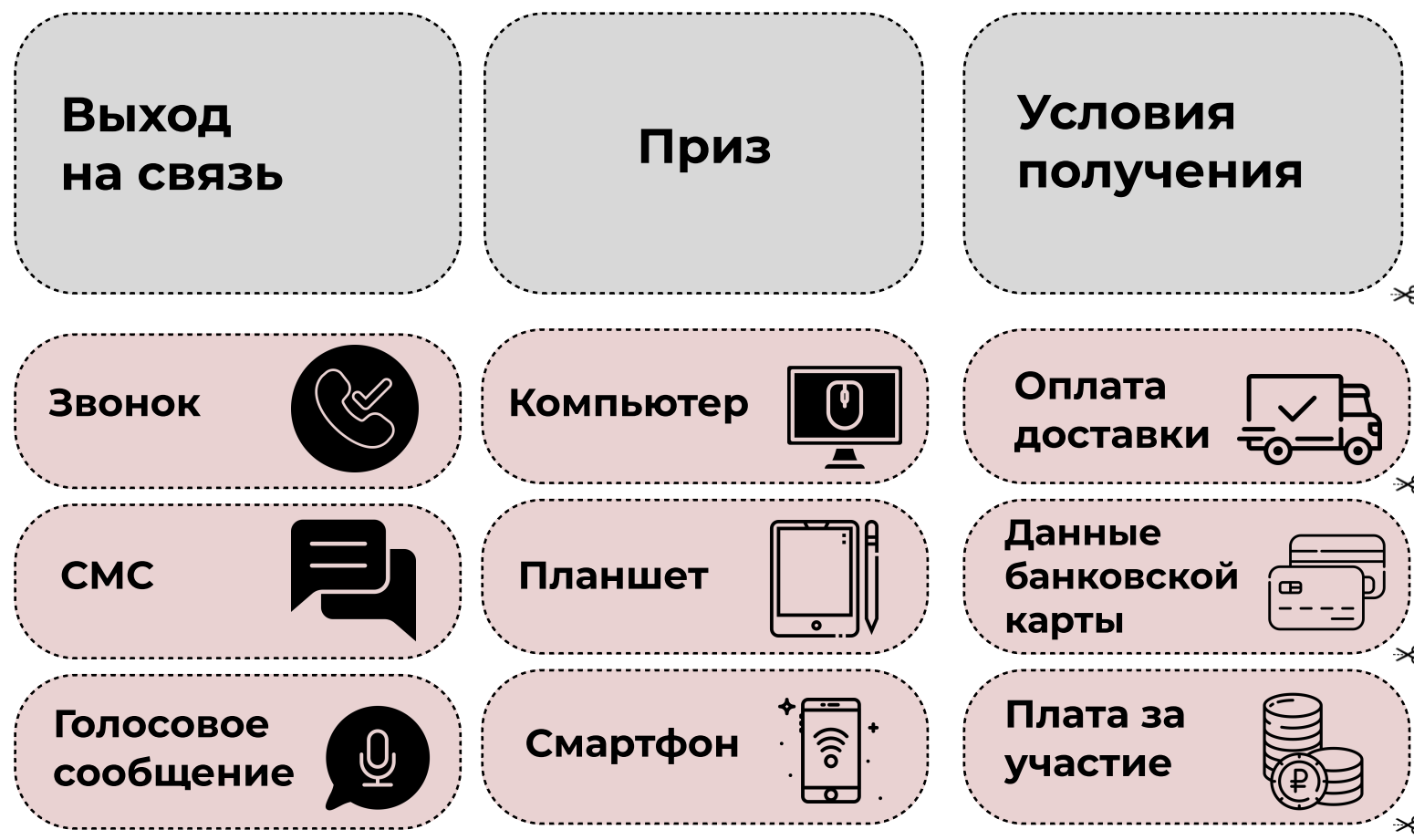
Схема работы мошенников